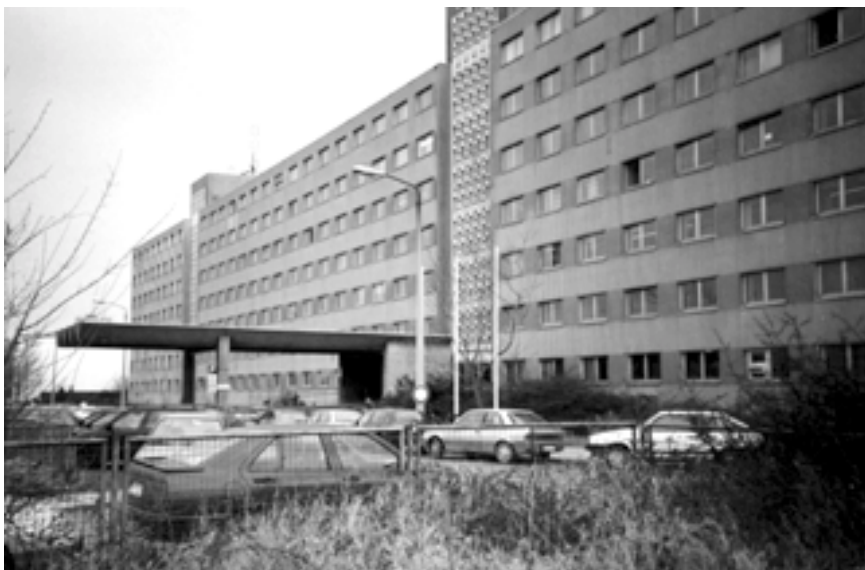
Die ehemalige Bezirksverwaltung Halle des Ministeriums für Staatssicherheit. Hier standen die Scheibttische der Offiziere.

Bevor sich das MfS zu einem Werbungsvorgang (IM-Vorlauf) entschied, wurden die in Frage kommenden sehr genau begutachtet. Es wurde in den Betrieben Einsicht in die Kaderakten (heute Personalakten) genommen. Die Stasi verstand sich sehr gut mit den Kaderleitern. Viele von ihnen waren nicht nur in der Firma integriert, in welcher sie angestellt waren. Um Informationen zu sammeln, wurde jede Chance genutzt. Nachforschungen wurden im Wohngebiet, der Gartenanlage oder im Sportverein betrieben. Jede Chance wurde genutzt. Trotzdem sollte niemand denken: „Es waren ja doch alle dabei.“ Das wäre gefehlt, nur viele hatten Angst, wenn das MfS kam, und redeten. Andere erfanden irgendeine Story, um keinen zu gefährden. Wenn das herauskam, gab es Druck. Dann konnte es passieren, daß er seiner Funktion im Sport- oder Gartenverein enthoben wurde. Auch im Kleinen wurde intrigiert und am Schicksal gepusht. Nicht Quantität war das Ziel, sondern Qualität. Schaltstellen des öffentlichen Lebens waren gefragt. Dort gab es wahre Fundgruben an Informationen. Parteigenossen in bestimmten wichtigen betrieblichen Stellungen zu befragen, erwies sich immer als gelungener