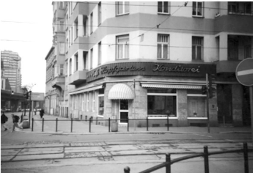
Cafe Hopfgarten. Hier und im Cafe Schade (siehe S. 55) traf sich die Szene.

Parteitagsziele durchzusetzen war für die Genossen nicht leicht. Eine Grundhaltung der meisten Bürger gegenüber diesen Zielen war, sich auf irgendeine Weise zu entziehen. Wirklich freiwillig gab es nur wenige bewußte, sozialistische Bürger! Die Staatssicherheit wußte von diesem Mangel. Und nannte diese Menschen im Dienstgebrauch „feindlich-negative Elemente!“ Die Geschichte hatte gezeigt, daß die meisten Diktaturen durch den Zerfall von innen untergegangen sind. „Der ärgste Feind lebte also im eigenen Staat.“ Um diesen Feind mit „Schild und Schwert“ zu bekämpfen, wurde ein sehr dichtes Spionagenetz geknüpft. Eines der besten der ganzen Welt. Schade, daß die DDR fast nur auf diesem Gebiet Weltniveau entwickelt hat.