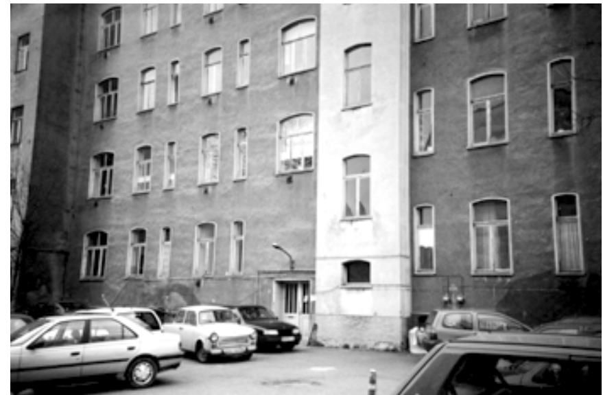
In diesem Gebäude befand sich das Bezirksliteraturzentrum Halle.

Ende der siebziger, Anfang der achtziger Jahre wurde durch die Parteipolitiker der DDR eine Idee geboren: Es sollten Literaturzentren in den Bezirksstädten gegründet werden. Aus dieser Idee wurde hoher Ministerratsbeschluß, denn mit der Gründung dieser Literaturzentren sollten alle Schreibenden der Bevölkerung zu einer Einrichtung strömen, die einen erzieherischen Aspekt erfüllen sollte.