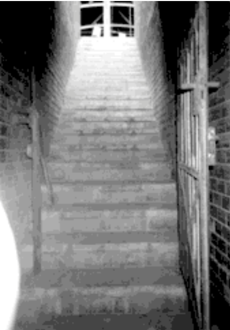
Treppenaufgang zum „Grotewohl-Express“