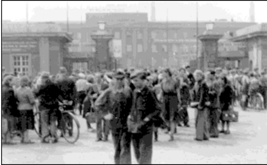
10.00 Uhr: Mitarbeiter sammeln sich vor Bau 24. Im Hintergrund über dem Portal der von den Demonstranten veränderte Schriftzug: „Wir wollen die Freiheit“.