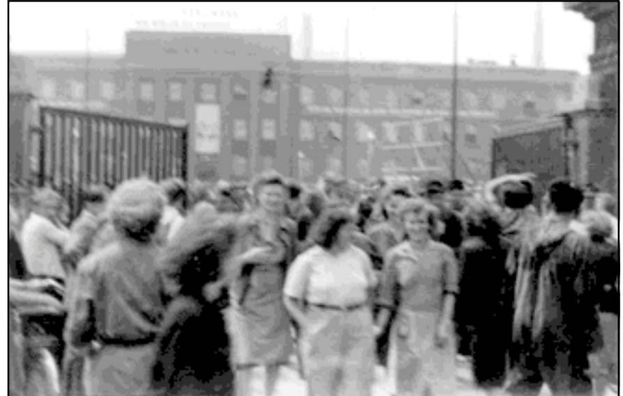
12.00 Uhr: Der Marsch nach Merseburg beginnt.