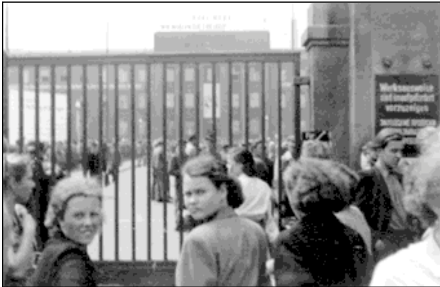
11.00 Uhr: VP hat Kontrolle am Haupttor eingestellt.