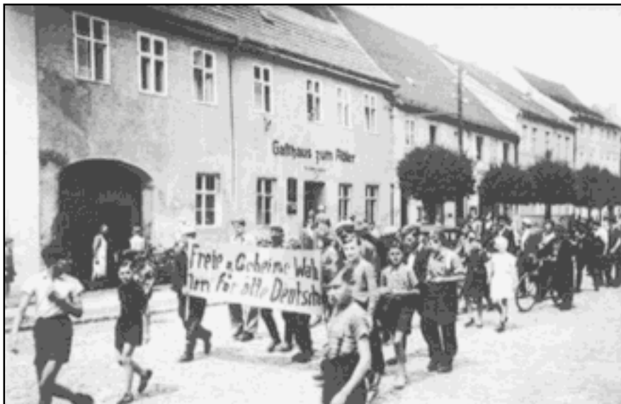
Jessen, Demonstrationzug vor dem „Gasthof zum Adler“