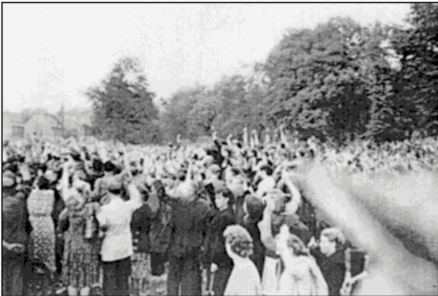
Kundgebung auf der Binnengärtenwiese