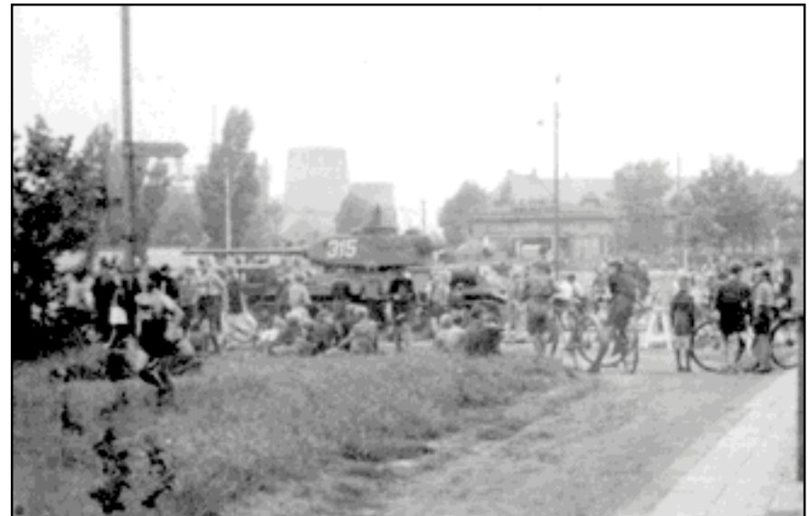
16.00 Uhr: Die ersten Russenpanzer treffen auf dem Haupttorplatz ein.