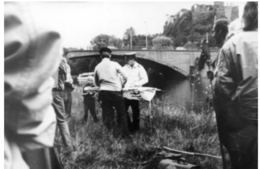
„Schauangeln“ an der Saale