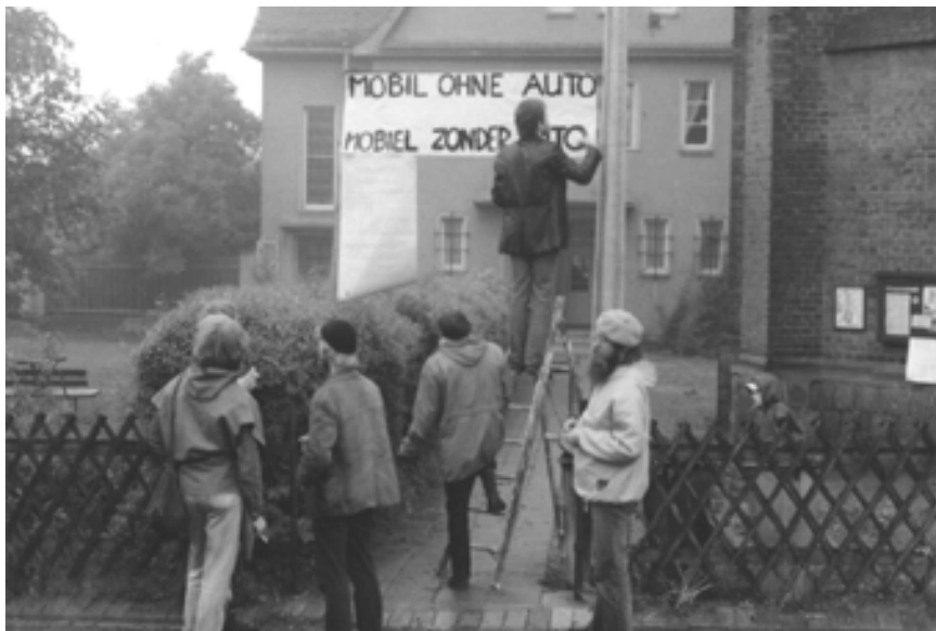
„Mobil ohne Auto“ - Vorbereitungen für den Sonntag in der Petruskirche mit einer holländischen Gemeindegruppe 1986

Die zahlreichen IM der ÖAG haben mich dann doch überrascht... Das Plakat des Eislebener Kirchentags 1984 mit der Losung 'Vertrauen wagen' und der sich öffnenden Hand war meine Maxime. Wie wir heute wissen, schlugen die damaligen Machthaber zum Schein in diese Hand ein, bereiteten aber gleichzeitig unsere Verbringung in Internierungslager vor. Heute weiß ich erst, wie naiv ich war und wie sehr sich auch die Kirche hat einwickeln lassen, um kleiner Vorteile willen..."