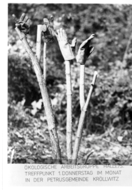
Einladungskarten zu den Treffen der ÖAG