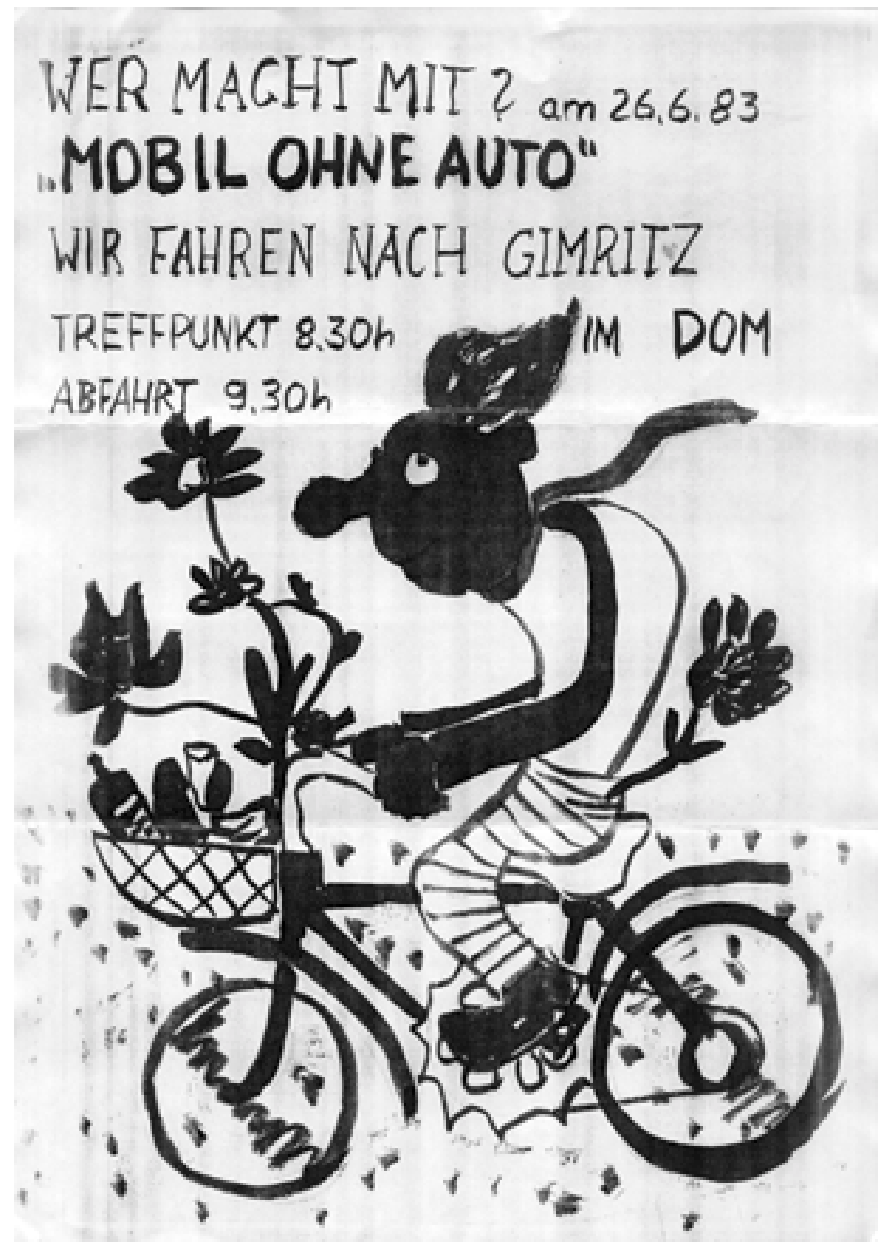
Kopie des farbigen Originalplakates für die erste Mobil-ohne-Auto-Tour in Halle

Die provozierenden Jugendlichen der Offenen Arbeit, die Gasmaskenradtour nach BUNA. Der Neid auf diese Idee und den Mut, sie umzusetzen. Die innere Solidarisierung und gleichzeitig das Gefühl, so ist's zu kurzatmig, schnell weggeholt von der Straße, und dann ist da keine wirkliche Veränderung.