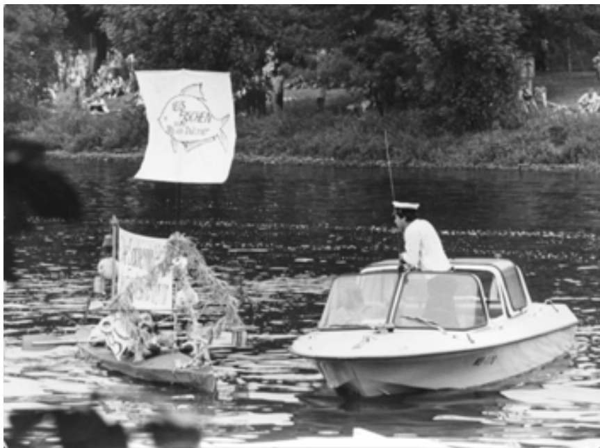
Faltboot mit Transparent („Die Saale nach 40 Jahr / die Fische sind noch rar“) wird von Polizeiboot aufgebracht. Laternenfest im August 1989

Die Teilnahme am Olof-Palme-Friedensmarsch in Dresden. Der Arbeitseinsatz auf dem jüdischen Friedhof. Meine Vorsprache beim Stadtkommandanten der Sowjetarmee, nachdem deren Panzer die Spazierwege durch die Heide, obendrein zur Zeit der Krötenwanderung, massiv als Übungsstrecke benutzten. Teilnahme mit eigenem Boot und Transparent (‘Umweltschutz tut not, wir sitzen alle in einem Boot’/ ‘Die Saale nach 40 Jahr, die Fische sind noch rar’) bei Halles größtem Volksvergnügen, dem Laternenfest auf der Saale in den Jahren 1988 und 1989. (Das Verhalten von Stasi und Sicherheitskräften zum Laternenfest 1989 war konfus. Übertriebenes Eingreifen dreier Polizeiboote und Ausrufen unserer Startnummer zog erst recht das Interesse Tausender auf mein Faltboot. Dabei war vom Vorjahr alles bekannt: selbes Boot, selber Slogan, offizielle Anmeldung beim Rat der Stadt, Abnahme des Bootes durch die Polizei, Prämierung des Bootes mit 50 Mark, Durchdrehen von Menschen