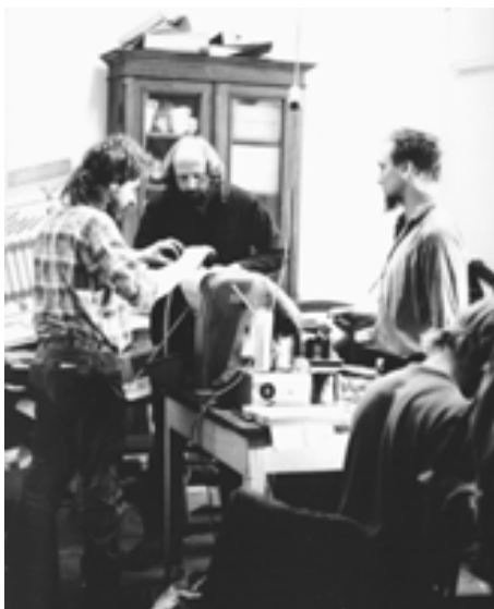
Druck und Korrektur der Zeitung „Das andere Blatt“ (Nachfolgepublikation des „Blattwerk“) 5. Januar 1990

Ich denke, das Zitat verdeutlicht, daß wir uns in ÖAG und Kirchenkreis die Souveränität unserer Entscheidungen und die Gestaltung unserer Beziehungen zueinander selbst nach Einschätzung des MfS nicht haben wegnehmen lassen.“