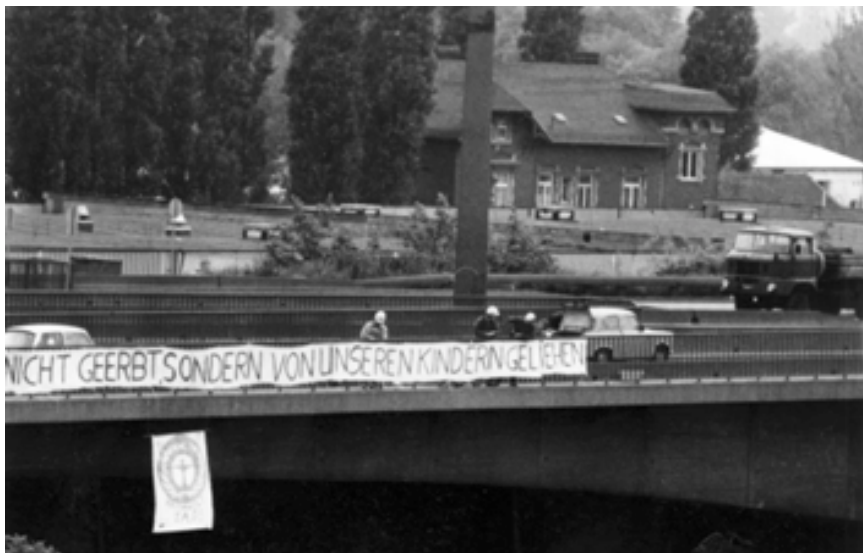
5. Juni 1989, Weltumwelttag: Installation des Spruchbandes „WIR HABEN DIESE ERDE NICHT GEERBT, SONDERN VON UNSEREN KINDERN GELIEHEN“ (auch S. 109)