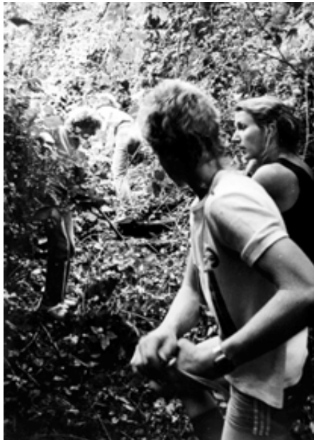
Arbeiten im alten Kröllwitzer Park (auch S. 103)

Es wurde geredet und geplant und gestritten, aber man tat auch, und nicht erst irgendwann, sondern oft schnell und vor der eigenen Haustür.