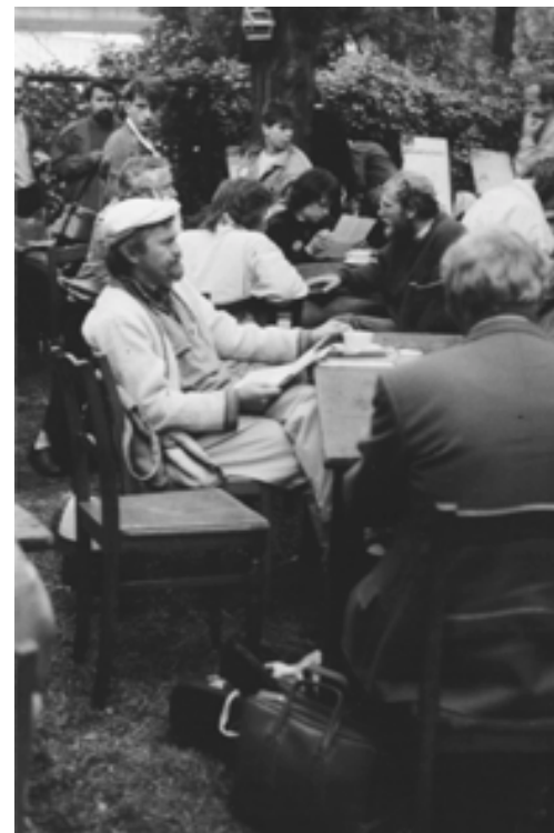
Eröffnung der Umweltbibliothek in der Georgengemeinde zum Kirchentag am 25. Juni 1988 mit Lese-Café auch im Freien (auch S. 106)

Versagt haben wir meiner Meinung nach auch bei der Pflege des Kröllwitzer Parks. Nach den Kämpfen um die Unterzeichnung des Vertrags haben wir zu schnell nachgelassen und schließlich aufgegeben. Dieses Grundstück wäre für uns eine große Chance gewesen, als Gruppe über längere Zeit eigenverantwortlich ein wertvolles Stück Natur zu pflegen... Wir hätten zeigen können, daß es uns nicht um spektakuläre Aktionen nur im Zentrum von Halle ging..."