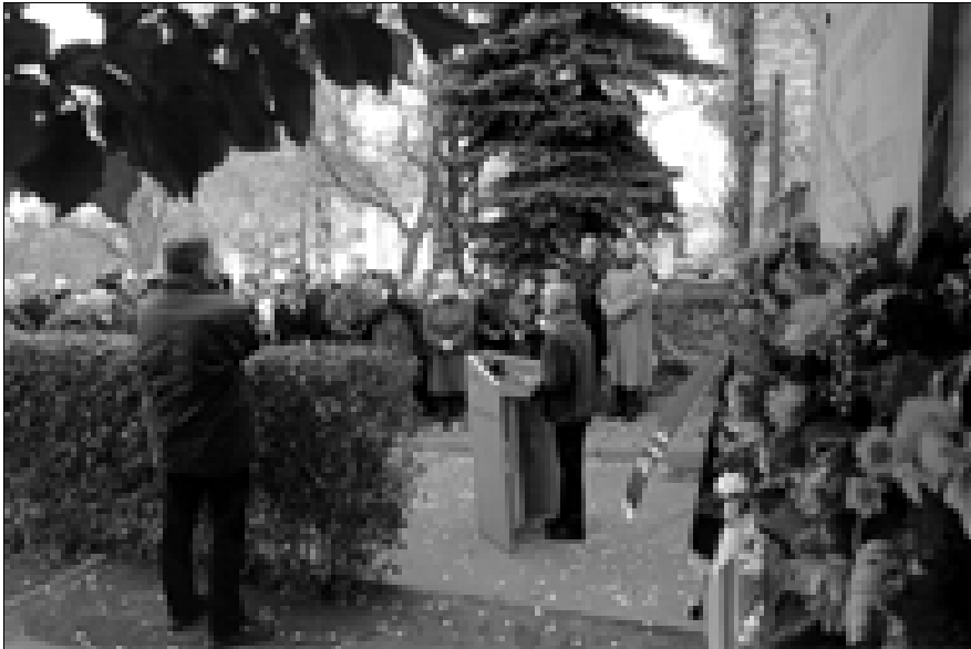
Gedenkveranstaltung in Querfurt am 8.11.2003

Zusätzlich wurden Vorträge der Landesbeauftragten zur Arbeit der Behörde und zu einzelnen Fragen der Aufarbeitung oder Grußworte in Sachsen-Anhalt auf verschiedenen Podiums- und Vortragsveranstaltungen gehalten: u. a. am 11.2.2003 in Potsdam in der „Arche“, am 30.5.2003 in Berlin (Kirchentag), am 12.6.2003 in Bernburg (Gedenkveranstaltung zum 17.6.1953), am 15.6.2003 in Helmstedt (Zonengrenzmuseum, Ausstellungseröffnung), 16.–18.7.2003 in Bonn (Erfahrungsaustausch der NRW-Landeszentrale für politische Bildung), am 13.8.2003 in Ballenstedt, am 6./9.2003 in Bitterfeld (Geschichtsexpress), am 2.10.2003 in Halle (Deutsch-Deutscher-Schüleraustausch), am 7./8.11.2003 in Querfurt (Gedenkveranstaltung), am 9.11.2003 in Berlin (Rathaus, Stiftung zur Aufarbeitung der SED-Diktatur), am 13.11.2003 in Düsseldorf (museum kunst palast).