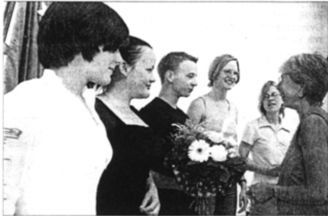
Blumen von Edda Ahrberg. Die Landesbeauftragte für die Stasi-Unterlagen gratuliert den Bitterfeldern zum 1. Platz.