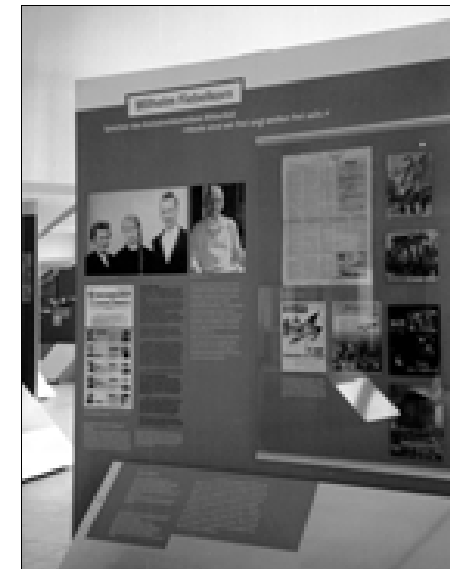
Ausstellungstafel zu Wilhelm Fiebelkorn