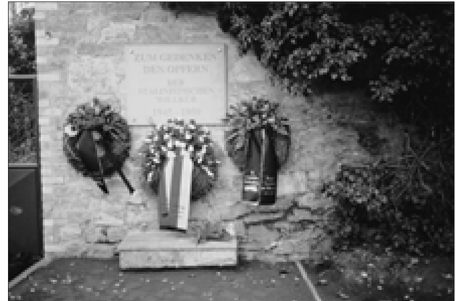
Gedenktafel „Zum Gedenken den Opfern der stalinistischen Willkür 1945–1950“