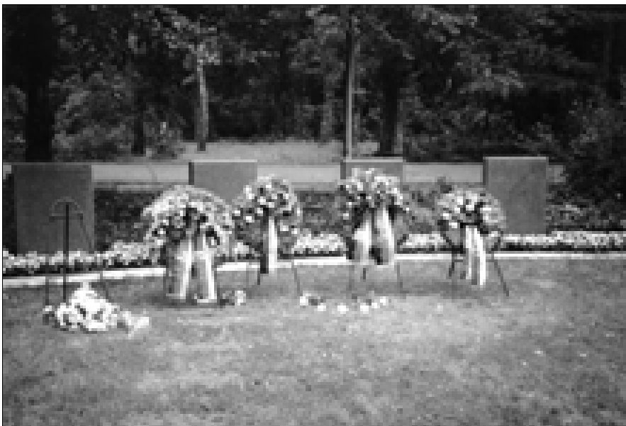
Grabanlage auf dem Gertraudenfriedhof

ungekürzt im Anhang wiedergegeben. Ebenfalls findet sich im Anhang eine Liste mit den Namen der in Torgau verstorbenen Häftlinge, die auf dem Gertraudenfriedhof bestattet wurden.