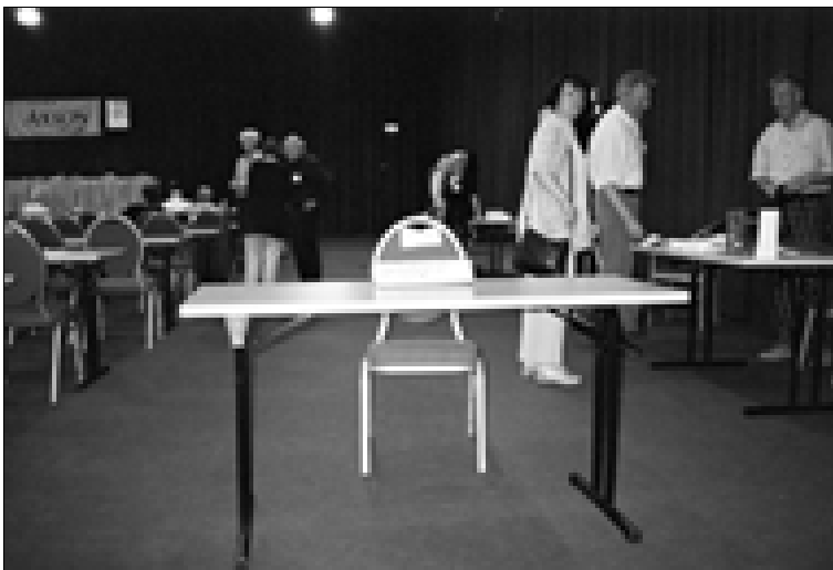
Der Stuhl des Brandenburger Landesbeauftragten bleibt leer

Nähere Informationen sind dem Tagungsband zu entnehmen, der in der Behörde des Berliner Landesbeauftragten zusammengestellt wird und kostenlos erhältlich ist. Der 8. Kongress wird vom 21. bis 23. Mai 2004 in Jena stattfinden.