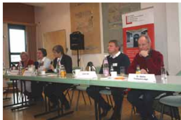
Fachtag im Roncalli-Haus zu Magdeburg, 22.11.2019

Die Fachtage ermöglichen einen persönlichen Austausch mit den Kooperationspartnern und bieten die Chance über die aktuellen Beratungsfragen zu sprechen. Dadurch gelingt eine optimale Anbindung an niedergelassene Psychotherapeuten,