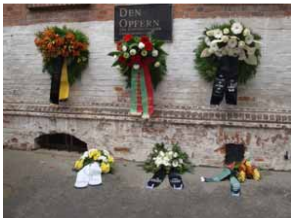
Kranz der Landesbeauftragten zur Aufarbeitung der SED-Diktatur: Gedenken zum Volkstrauertag in der Gedenkstätte Magdeburg, Moritzplatz