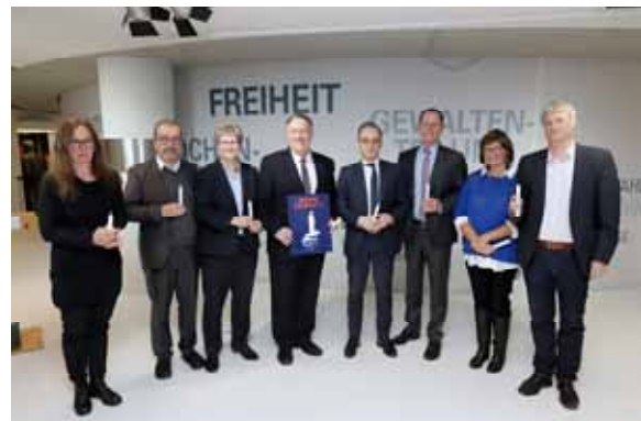
Gruppenbild nach Zeitzeugengespräch am 7.11.2019 mit Secretary of State Pompeo und Bundesaußenminister Heiko Maas in Leipzig, Zeitgeschichtliches Forum aus Anlass 30 Jahre Friedliche Revolution