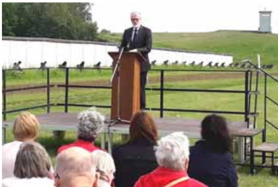
Staatsminister Rainer Robra vor Gästen

Es war eine mehr als würdige Einweihung des neuen Kulturraumes der Gemeinde Hötensleben.