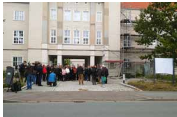
Indienstnahme Gedenkstein am LAU, Halle (Saale)