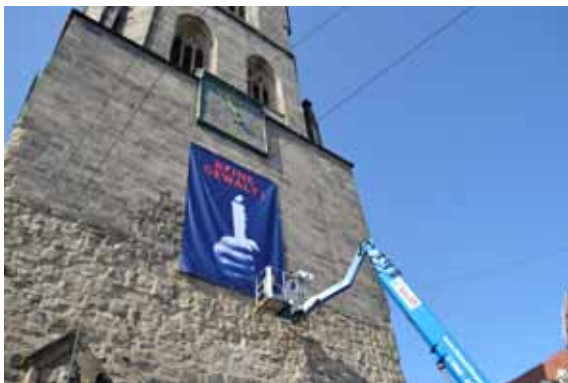
Roter Turm, Halle (Saale)

Auf einer großen Leinwand wurde der Überwachungsfilm der Staatssicherheit vom Marktplatz gezeigt, der von vier Zeitzeugen kommentiert wurde. Publikumsmeldungen sowie die Ergänzungen der Außenstellenleiterin der BStU Halle, die parallel die Aufzeichnungen des MfS aus dem Lage-Protokoll vortrug, gaben ein gutes Bild über die damaligen Ereignisse.