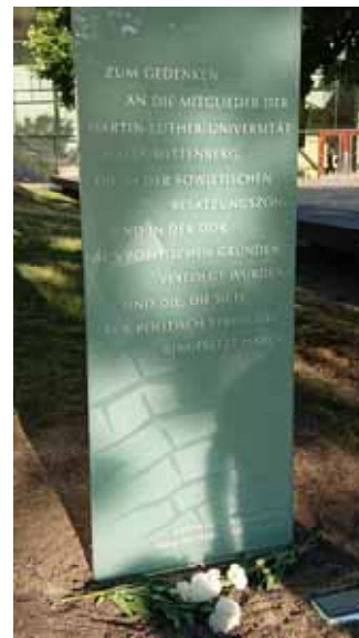
Einweihung der Gedenkstele für die verfolgten Studenten und Professoren an der MLU Halle mit Prof. Dr. Rita Süßmuth, Präsidentin des Deutschen Bundestages a. D., 17.6.2019

vor Ort in der öffentlichen Erinnerung zu bewahren und diejenigen zu ehren, die Entrechtete schützten, wie z. B. Professoren an der Universität Halle. Es ist für Verfolgte und ihre Angehörigen sehr wichtig, dass hier bleibende Erinnerungszeichen gesetzt werden und umgekehrt (erneut) verletzend, wenn dieses Anliegen von der Öffentlichkeit nicht geteilt wird.