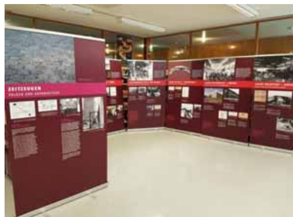
Wanderausstellung „Hammer•Zirkel•Stacheldraht“ der Landesbeauftragten in baden-württembergischen Schulen