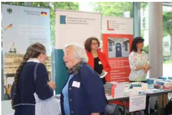
Informationsstand beim Bundeskongress in Berlin

30 Jahre nach der Friedlichen Revolution 1989 wurde der Stand der bisherigen Arbeit bilanziert, und zugleich der Blick auch in die Zukunft gerichtet. Diskutiert wurde zum Beispiel, wie es gelingen kann, nachkommende Generationen für die Aufklärung über die SED-Diktatur und den Umgang mit ihren Opfern zu interessieren.