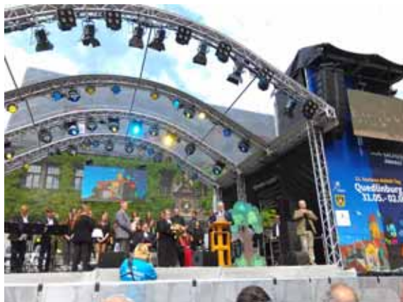
Sachsen-Anhalt-Tag Quedlinburg 31.5. bis 2.6.2019