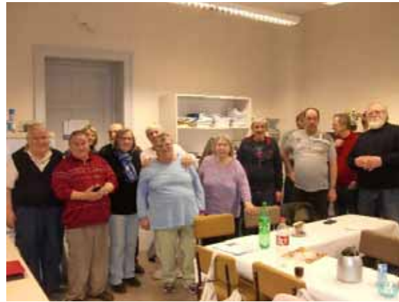
VOS Gruppe Bernburg