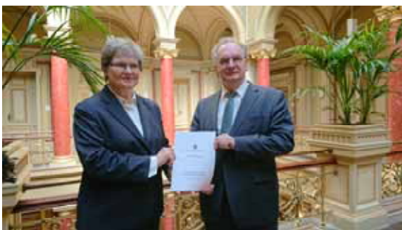
Übergabe des Tätigkeitsberichts 2018/2019

Die Landesbeauftragte und ihre Mitarbeiterinnen und Mitarbeiter genießen bei Bürgerinnen und Bürgern großes Vertrauen und hohes Ansehen. Die Zusammenarbeit mit den zuständigen Ämtern und Behörden des Landes erfolgt in enger Abstimmung und mit großem Interesse. Ihrer Arbeit wird von Seiten der Landtagsfraktionen großes Interesse entgegen gebracht. Dadurch kann sie sich auf eine breite parlamentarische Zustimmung stützen. Die Landesbeauftragte ist in regelmäßigem Kontakt mit Fraktionen, Arbeitskreisen und Ausschüssen.