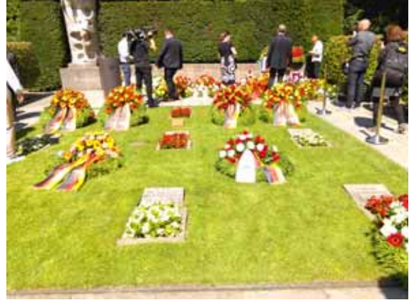
Gedenkveranstaltung Friedhof Seestraße