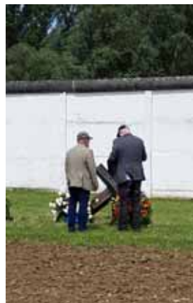
Gedenkveranstaltung (GDV) Hötensleben