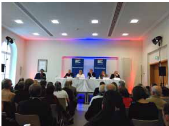
Bautzen-Forum 9. bis 10.5.2019