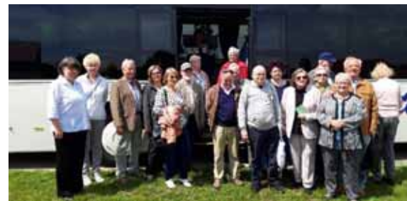
Teilnehmer der GDV Hötensleben