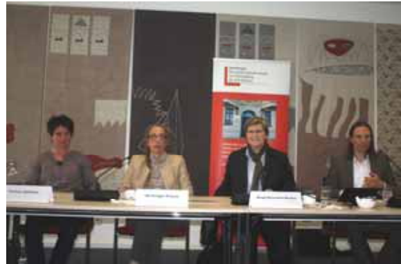
Fachtag „Folgen des Dopings im Leistungssport der DDR“ im Landtag zu Magdeburg, 15.5.2019