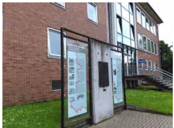
Informationen am Gebäude der ehemaligen Zentralen Erfassungsstelle (Fotos: Salzgitter, 12.6.2019)

Zu Beginn der Veranstaltung wurde der Film „Archiv des Unrechts“ gezeigt, der die Geschichte der Zentralen Erfassungsstelle in Salzgitter-Bad zum Thema hat. Auf bildhafte Art zeigt er Einzelschicksale aus den insgesamt 42.000 Akten, die dort im Rahmen von Vorermittlungen gesammelt wurden. Auf Grundlage dieser Akten konnten nach der deutschen Einheit viele Täter für ihre Straftaten verurteilt werden.