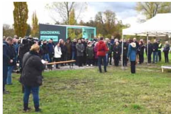
Eröffnung des neuen Besucherleitsystems