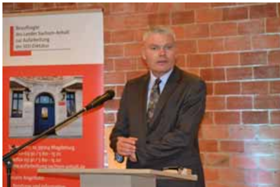
Innenminister Holger Stahlknecht