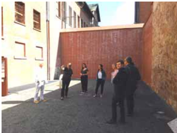
Gedenkstätte ROTER OCHSE Halle Saale, interne Fortbildung am 21.8.2019

Am 21. August 2019 fand eine Fortbildungsexkursion der Behörde nach Halle (Saale) statt. Die Mitarbeiterinnen und Mitarbeiter besuchten die Georgenkirche, den Ort