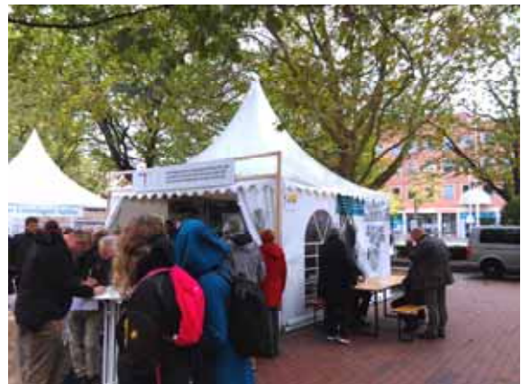
Bürgerfest zum Tag der deutschen Einheit Kiel 2. bis 3.10.2019