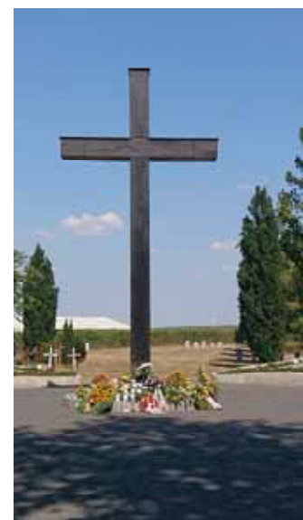
Mühlberg 31.8.2019: Landesbeauftragte hält Gedenkrede im ehemaligen Speziallager Mühlberg