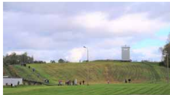
Abbildung 1: Besucher am Grenzdenkmal.

Bei den angemeldeten Führungen wurden am Grenzdenkmal ca. 2000 Personen eingewiesen. In diesem Jahr war alles anders als sonst. Die Nachfrage war durch das dreißigste Jubiläum der Wiedervereinigung sehr hoch. Es gab sehr viele Anfragen, wie auch pandemiebedingte Stornierungen. Es ist erstaunlich, dass dennoch die Anzahl der Führungen trotz der Pandemie sehr hoch war.