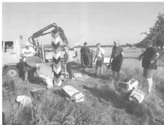
Aufstellung der ersten Grenzsäule 928 am „Sandbrink“ bei Abbenrode