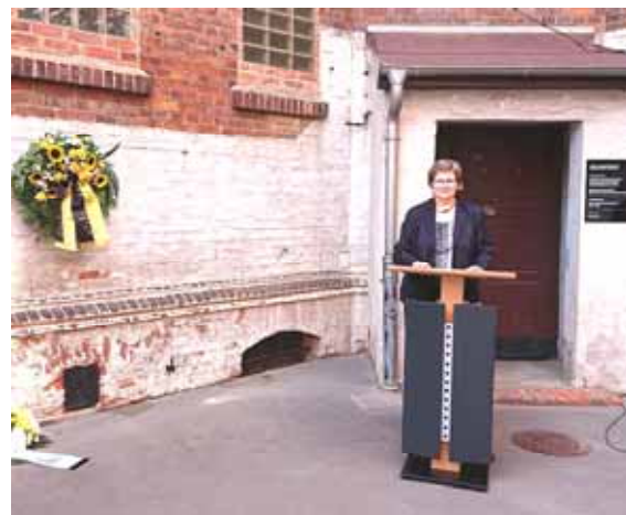
Ansprache 17. Juni 2020 Gedenkstätte Moritzplatz Magdeburg

30 Jahre Deutsche Einheit bedeuten für Betroffene von Gewalt und Terror in der kommunistischen Diktatur das Ende der Lüge, das Ende Gewalt und das Ende der Angst vor der Gewalt.