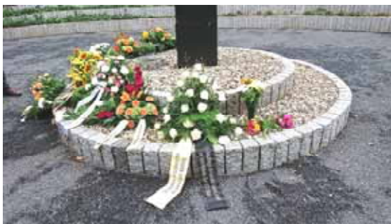
Mühlberg – Gedenkveranstaltung – 5.9.2020: Kränze der Landesbeauftragten, der Stiftung Gedenkstätten und der Opferverbände

Die Landesbeauftragte nahm an den unter Hygienevorschriften ermöglichten Gedenkveranstaltungen am 26. Mai zur Erinnerung an die Zwangsaussiedlungen in Höstensleben, am 17. Juni 1953 in der Gedenkstätte am Moritzplatz sowie auf Einladung der Initiativgruppe des Speziallagers Mühlberg an der Gedenkveranstaltung beim 30. Gedenktreffen für die Opfer des STALAG IV und des Sowjetischen Speziallagers Nr. 1 am 5.9.2020 in Mühlberg/Elbe teil.