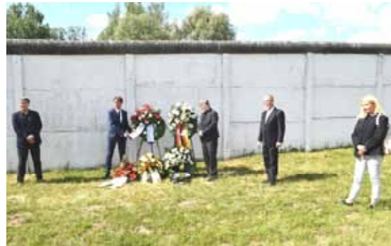
Stille Kranzniederlegung in Hötensleben am 26.5.2020

Der Landesbeauftragten ist es deshalb wichtig, an konkrete Ereignisse und Daten der Repression zu erinnern. Dazu gehören das Datum der Zwangsaussiedlung an der innerdeutschen Grenze mit der Aktion Ungeziefer am 26. Mai 1952, das Datum des Mauerbaus am 13. August 1961, die Niederschlagung des 17. Juni 1953 aber auch – um die Nachkriegsgeschichte einordnen zu können – das Datum des 23. August 1939: der ‚Hitler-Stalin-Pakt‘, der von Molotow und Ribbentrop abgeschlossen wurde. Aus diesem Anlass lädt die Landesbeauftragte mit dem Zeitgeschichten e. V. in Halle regelmäßig ein, in 2020 zu einer öffentlichen Filmvorführung.