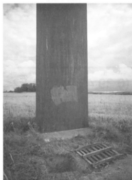
Erste Vorbereitungen zur Aufstellung Grenzsäule 928 am Sandbrink

Schweißtreibende Arbeit am ehemaligen Todessteifen im Nordharz. Mitglieder des Heimatvereins Abbenrode und Stapelburg sowie des Grenzerkreis Abbenrode setzten Mitte August gemeinsam weitere 3 Grenzsäulen an markanten Stellen entlang der ehemaligen innerdeutschen Grenze im Nord-