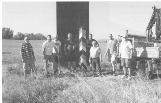
Die erste Säule steht. Im Hintergrund eine der 8 Stelen des Environments „Schrotthaufen der Geschichte“ (Grenzdenkmal Wennerode).

harz. Die Standorte am Jungborn / Europaradweg R1, am „Altfeld/Altfelder Krug“ und an der K1332 „Sandbrink“ bei Abbenrode ergänzen somit den weiteren Ausbau des Nordharzer „Grenzlehrpfades“, der sich vom Jungborn Stapelburg bis zum Fallstein, auf fast 15 Km Länge, erstreckt. Die Säulen tragen die laufenden Nr. 928, 938 und 949 der einst mehr als 2700 Grenzsäulen an der ehemaligen Grenze von Hof bis an die Ostseeküste standen. Die neuen Aufstellungsorte für die Denkmale, sollen ein „Denkmal-nach“ für den Betrachter auslösen. Eine Erweiterung mit erklärender Schautafel ist in Vorbereitung. Die Metallgrenzsäulen wurden von der Deutschen Erz- und Metall-