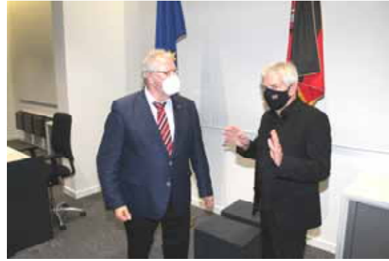
Roland Jahn beim 6. Gemeinsamen Treffen mit Hartmut Büttner.

Nach einem jahrelangen Diskussions- und Abstimmungsprozess kommen die Stasiunterlagen jetzt unter das Dach des Bundesarchivs. Dabei bleiben die Akten nach Aussage von Roland Jahn an ihren bisherigen Standorten in den östlichen Bundesländern.