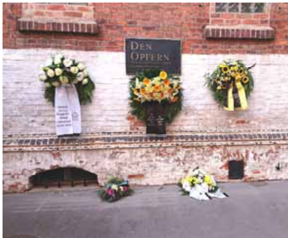
17. Juni 2020 Gedenkstätte Moritzplatz Magdeburg

Jaroslav Seifert, Literaturnobelpreisträger (niedergeschrieben zu Beginn des Prager Frühlings)